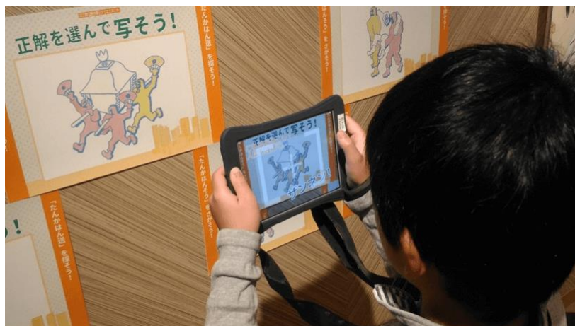
災害医療クエスト：小中学生向けタブレット教材実施例