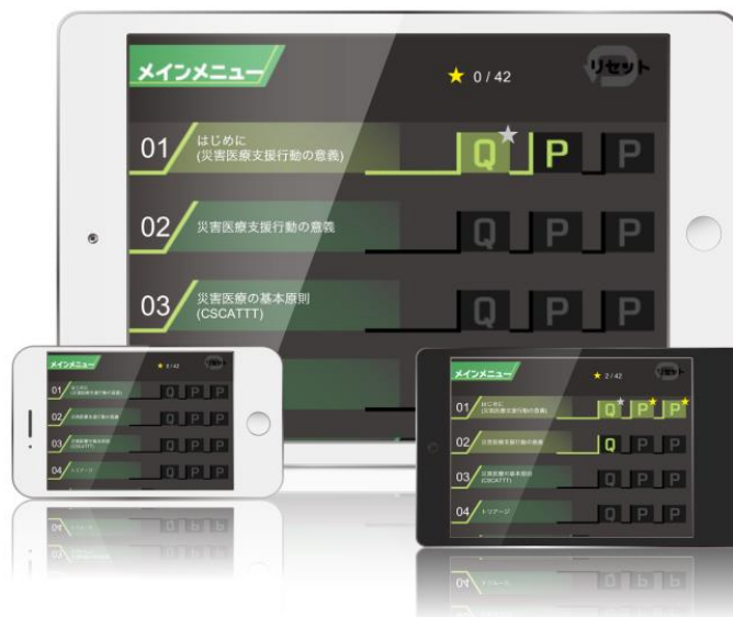
災害医療タッチ：インタラクティブな教科書（iOS と Android 用）